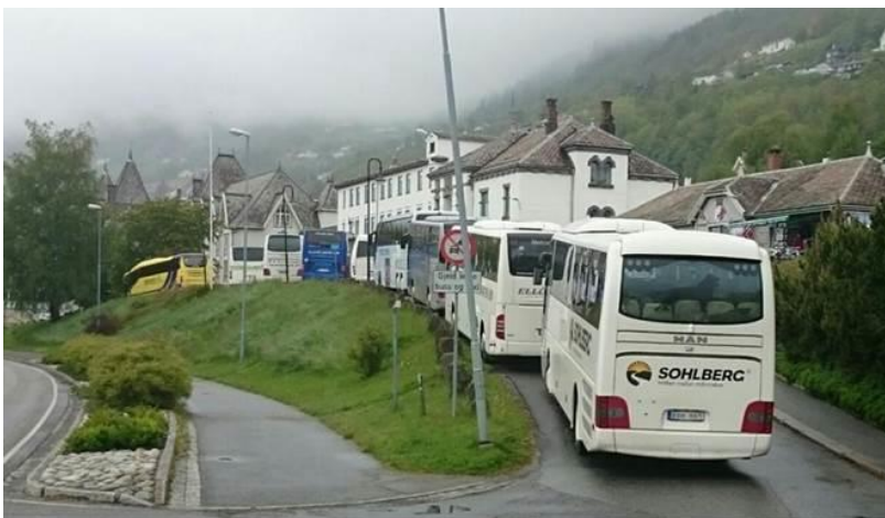
Figur 7 I sommarsesongen er det tidvis kaotiske tilstander ved Voss stasjon. Planlegginga av ny bussterminal er under arbeid, med planlagt byggestart i 2016.