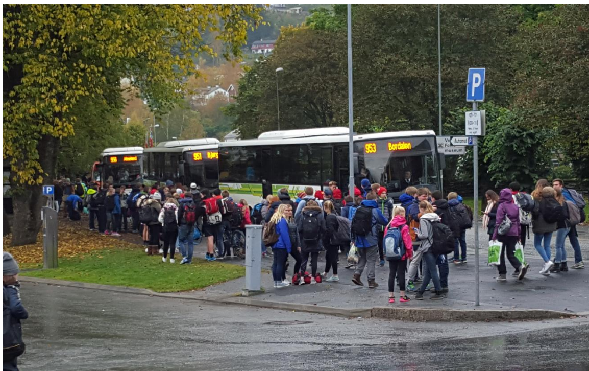
Figur 4 Elevar på veg heim frå skulen på Voss. Behovet for skuleskyss er dimensjonerande for vognparken i distrikta. Det er store gevinstar å hente mellom anna i betre samordning av start- og sluttider for skulane.

Betre samhandling og koordinering med kommunar og skular når det gjeld skulestruktur, skuleruter og start- og sluttider ved skulane vil kunne gje store gevinstar i å utforme kostnadseffektive løysingar.