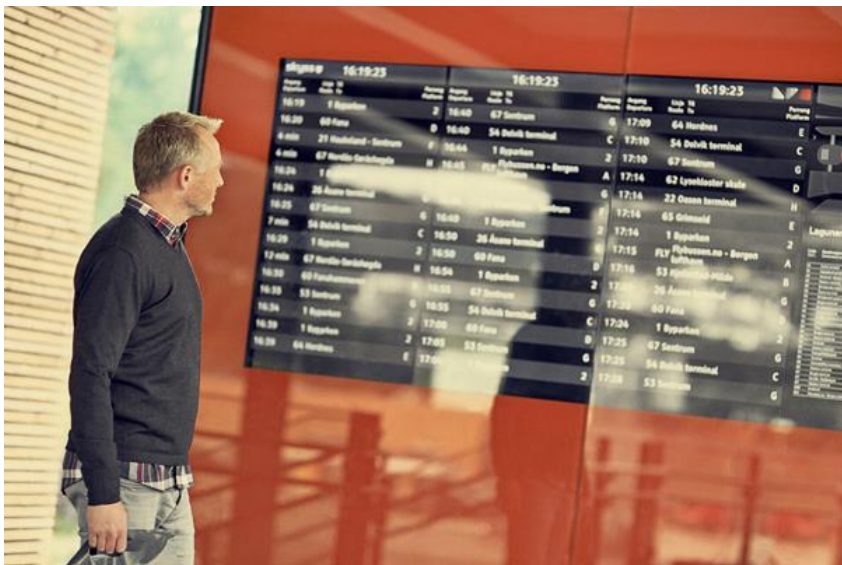
Figur 6 Skyss vil vidareutvikle bruk av digital trafikantinformasjon, og prioritere skreddarsydde informasjonsløysingar til store arbeidsplassar.

Marknadsføring av eksisterande linjenett vil framleis vere ein viktig del av marknadsarbeidet, og