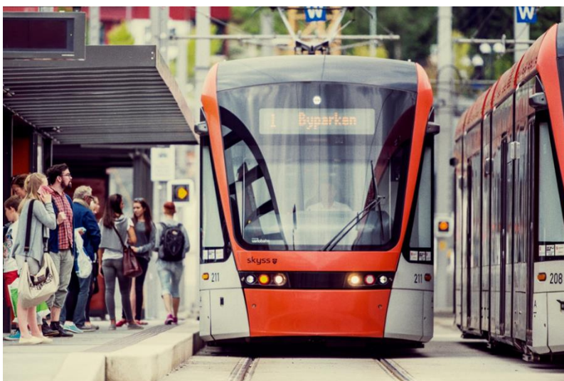
Figur 3 Planlegging av nye byggetrinn for Bybanen pågår. For strekninga Bergen sentrum – Haukeland – Fyllingsdalen er løysingar for sentrum avgjerande.

Arbeidet med ny regional transportplan 2018-2029 skal inkludere ei samanstilling/utgreiing av eit framtidig hovudlinjenett for kollektivtrafikken i Hordaland, basert på forventa transportbehov og reisemønstre.