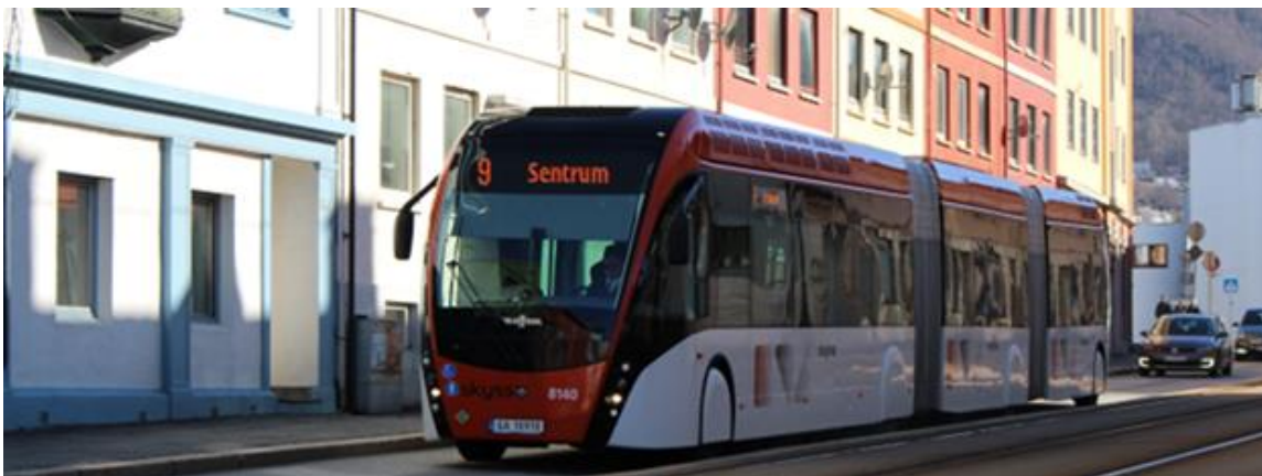
Figur 9 Biogasshybridbussane som er testa ut har svært låge utslepp. Utslepp av \text{NO}_2 er nær null, og \text{CO}_2 -utsleppa er 15-20 % lågare enn frå ein konvensjonell leddbuss som går på gass.

Effekten av dette arbeidet vil vere reduksjon i utslepp av klimagassar frå kollektivtrafikken, når ca. 80 bussar går over frå naturgass til biogass i Bergen sentrum. Ei utviding av bruken til å gjelde fleire bussar vil krevje auka kapasitet i biogassanlegget.