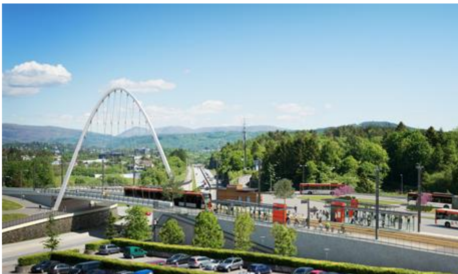
Figur 2 Med Bybanen til flyplassen blir Birkelandsskiftet eit viktig knutepunkt for kollektivtrafikken i Ytrebygda, med bytte mellom buss og bane, og innfartsparkering. Illustrasjon: Bybanen utbygging/Fabian Schnuer Gohde

Gode passasjertal som viser kvar i kollektivnettet folk reiser er avgjerande. Det er installert system for automatisk passasjertelling i om lag 35 prosent av bussparken i Bergensområdet. Skyss arbeider med å etablere kvalitetssikring av tala og verktøy for analyse. Det vil vere behov for betre dekning i Bergensområdet og på Bybanen. I tillegg er det behov for betre passasjertal ut over Bergensområdet. Det er også behov for betre verktøy og kapasitet til analyse av køyretider for planlegging og evaluering av infrastrukturtiltak for kollektivtrafikken.